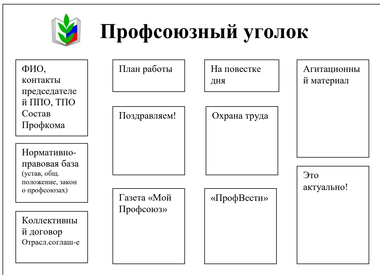
Рис. 2 Примерный образец оформления профсоюзного уголка

Важно, чтобы вся информация на стенде имела прямое отношение к деятельности профсоюзной организации.